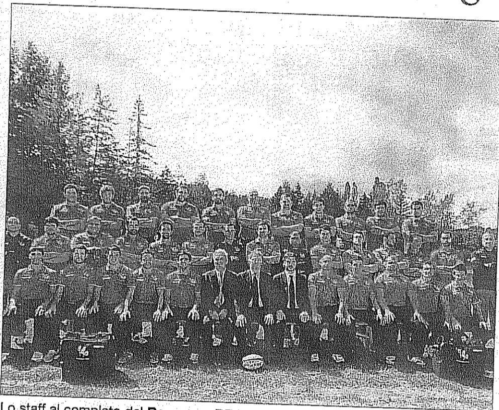
Lo staff al completo del Romagna RFC